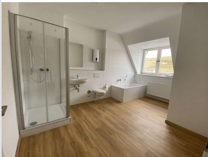
großes helles Badezimmer

Zimmer: 3,00 Wohnfläche ca.: 106,00 m 2 Kaltmiete: 1.040,00 EUR (zzgl. Nebenkosten) Gesamtmiete: 1.290,00 EUR